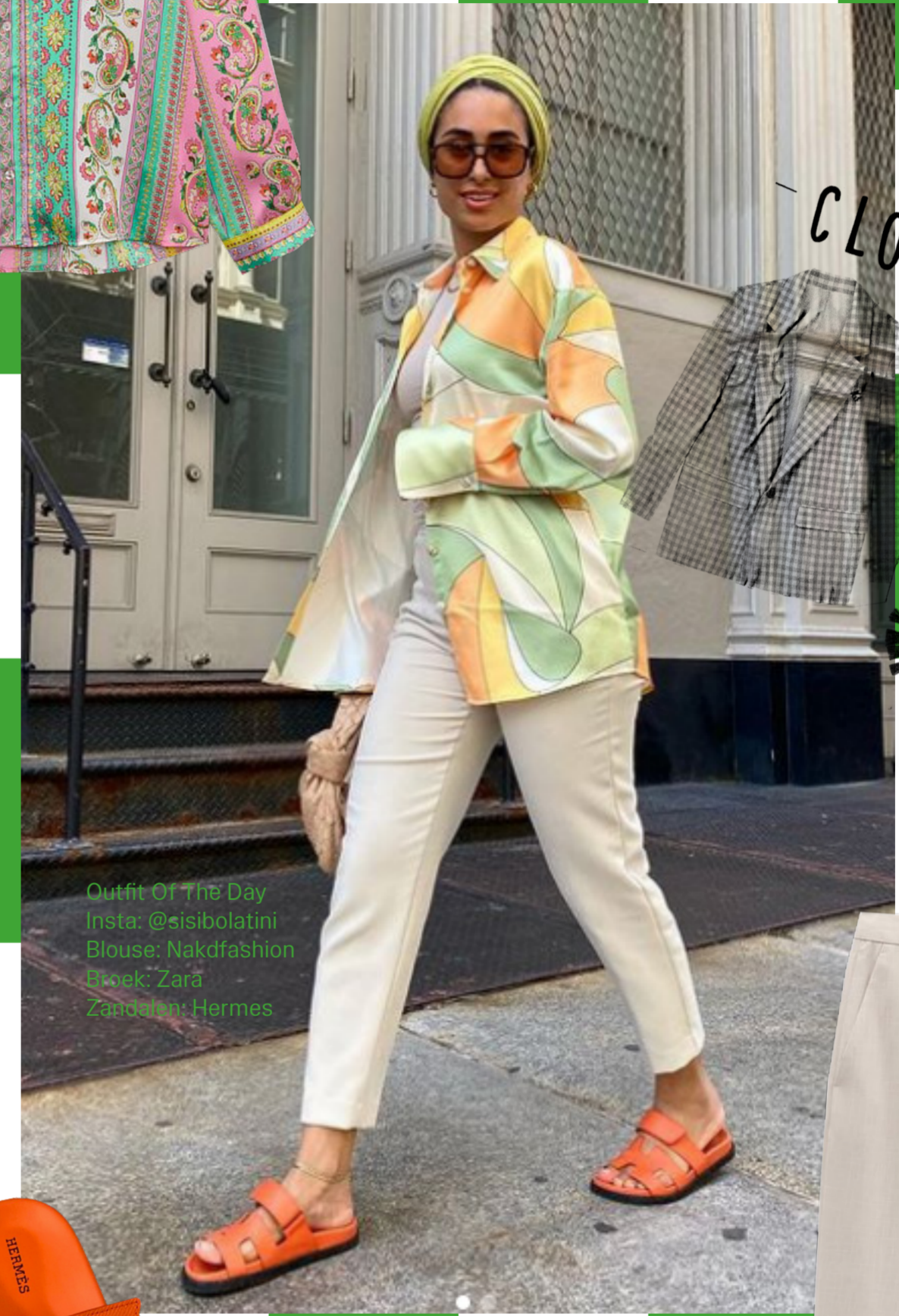
Outfit Of The Day Insta: @sisibolatini Blouse: Nakdfashion Broek: ZARA Zandalen: Hermes